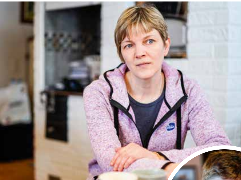
Sanna korostaa genomitestauksen ja rakennearvostelun merkitystä.