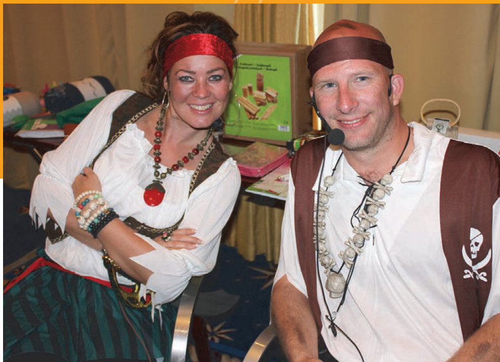
Penelope Cruz og Johnny Depp i Seminarutvalget.