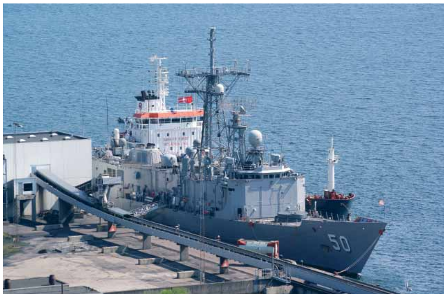
Den amerikanske fregat USS Taylor ligger ved kaj ved Amagerværket. Bagved ses et dansk olieskib, der forsyner den amerikanske gæst med nyt brændstof.