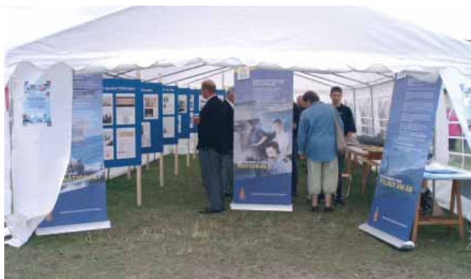
Ebeltoft Marineforenings informative udstilling ved Ebeltoft Maritime Dage fik mange roser med på vejen.