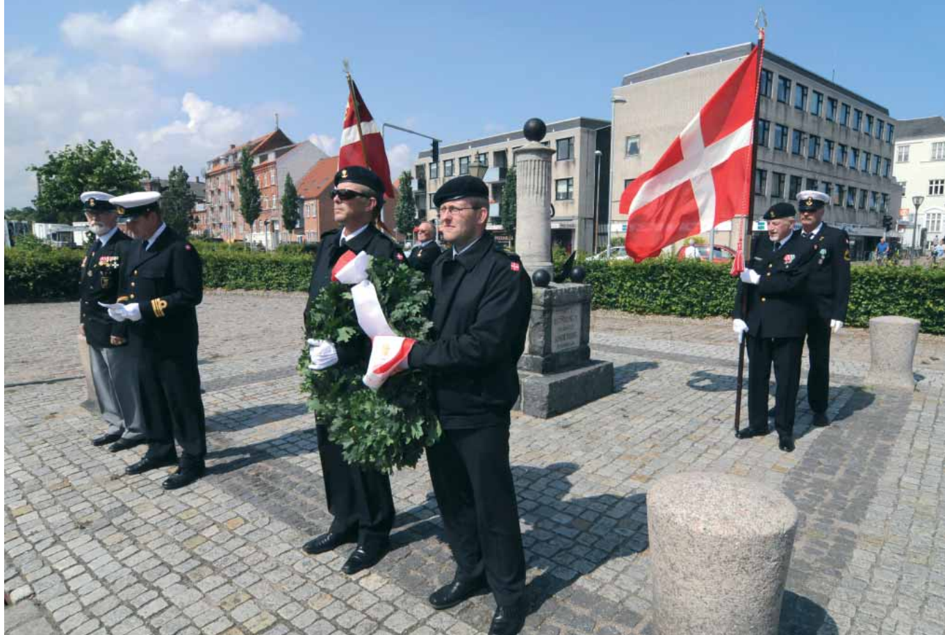
Nyborg Marineforening og Marinehjemmeværnet under kranselægningen i Nyborg.