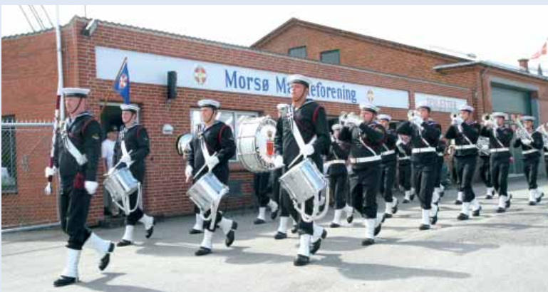
Søværnets Tamburkorps musicerede i Nykøbing Mors i forbindelse med GLENTENS adoptionsbesøg. Her marcherer det populære korps forbi Morsø Marineforenings lokaler.

Lørdag kl. 0930 blev byens borgere vækket af Søværnets Tamburkorps, som marcherede fra Rådhuset, gennem den centrale bydel ned til havnen. På kajen var der opstillet boder, og der var åbent skib på både MAKRELEN og HIRSHOLM, hvor der også var mulighed for en sejltur med det nye skib, hvad 80 borgere benyttede sig af de 4 timer det stod på. Vagtfri besætning blev af Marineforeningen hentet til marinestuen, og herfra gik det med "Bjergbanen" til Lemvig Station, hvorfra alle med VLTJ tog toget til Fiskedag i Thyborøn. Ved besøg på fiskedagen, aflagde MAKRELEN 's besætning besøg på Thyborøn Marineforenings stand, hvor man overleverede skibets våbenskjold ▶