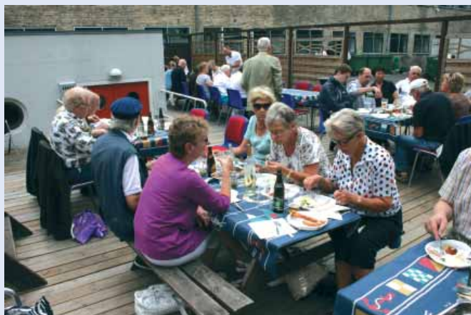
Der hygges ved København Marineforenings grillparty.

Oktober byder på orlogsgastens dag den 6. på Frederiks-