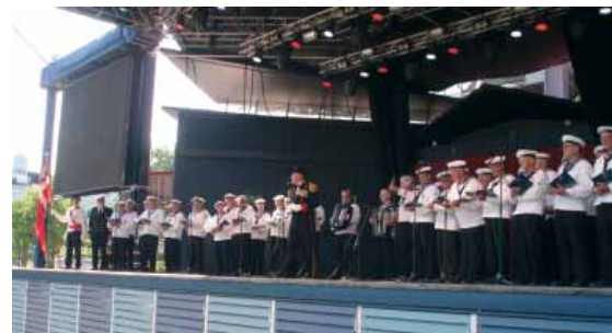
Slupkoret fra Ebeltoft Marineforening havde stor succes på den store scene i Københavns Tivoli

Kvaliteten af de lokale marineforeningers sangkor er i disse år stærkt stigende. Bevisførelsen ligger lige for. Da projektgruppen bag Søværnets 500 års jubilæumsarrangementer (PG500) fik mulighed for at sætte Søværnet på landkortet i forhold til Danmarks formodentligt bedst kendte underholdningssted – Tivoli i København – blev det besluttet, at ud over den opmærksomhed de mange udenlandske flådebesætninger ville få, når de uniformeret lagde vejen forbi Tivoli,