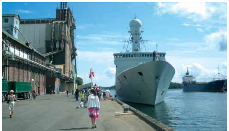
Svendborg Kommunes adoptionskib, inspektionsskibet THETIS, ankommer fredag den 6. august til jubilæumsfest i byen.

IViborg havde bestyrelsen sammen med Viborg Kommune fået adoptionsenheden Søværnets Helikopter Tjeneste, der er bosat i kommunen på Karup Flyveplads, til at give retningsopvisning over Viborg Sønder sø. Det hele under