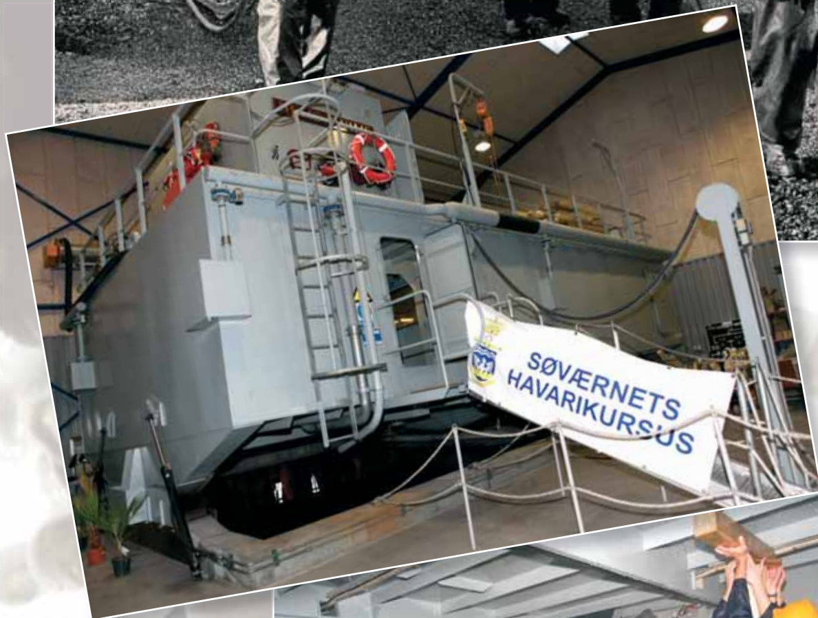
Damage Control Unit (DCU). Søværnets Havarikursus' øvelsesenhed.