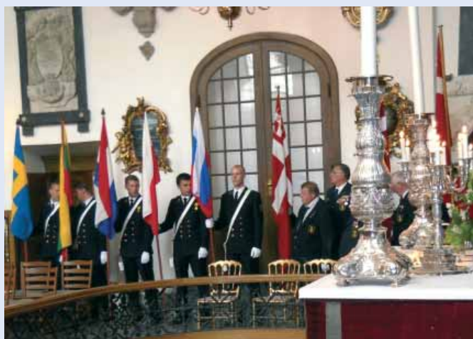
Flagene omkring altret ved flåde gudstjenesten i Holmens Kirke den 15. august 2010.