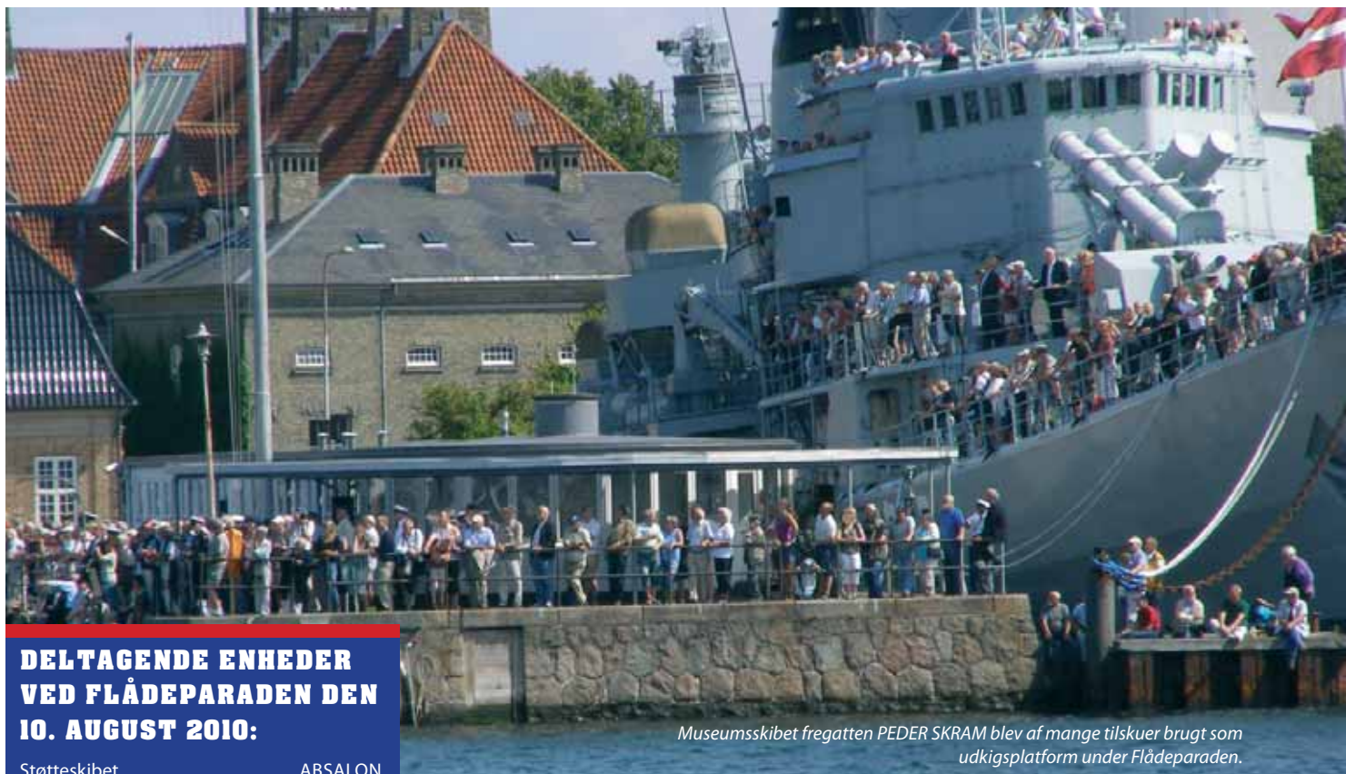
Museumsskibet fregatten PEDER SKRAM blev af mange tilskuere brugt som udkigsplatform under Flådeparaden.

heder, der på det tidspunkt var ankommet til Københavns Havn, samt om de danske enheder der deltog i flådeparaden forbi kongeskibet DANNEBROG. Tordenskioldsselskabets fartøj lagde sig i Havneindsejlingen og fulgte derefter Støtteskibet ABSALON og Kommandoskibet THETIS ind gennem havnen op til DANNEBROG.