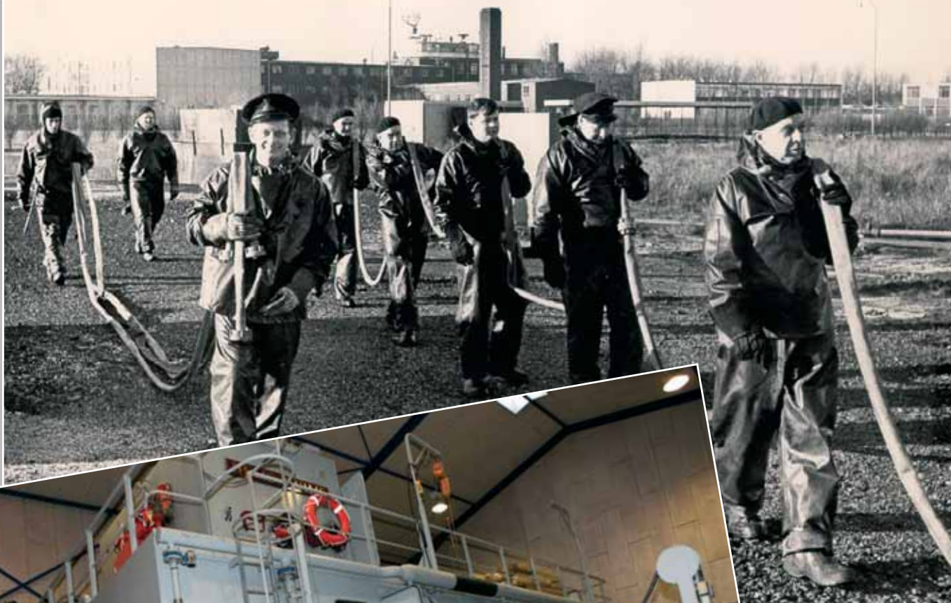
Øvelse på Margretheholm i København.