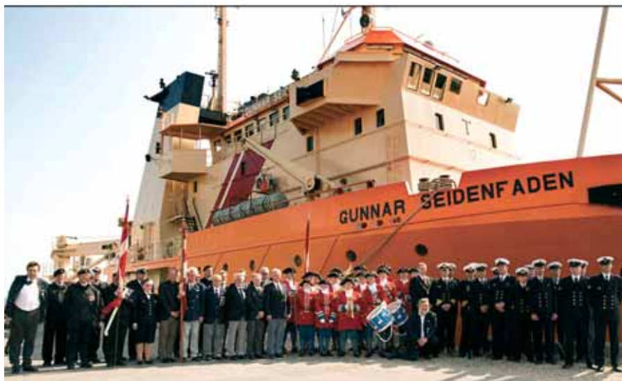
Miljøskibet GUNNAR SEIDENFADEN blev i Vordingborg modtaget med pomp og pragt.

Besøgssevenen havde følgende omfang: ROTA i Næstved. SVANEN og THYRA i Rungsted. ERTHOLM og ALHOLM i Haderslev. FYRHOLM i Marstal. GUNNAR SEIDENFADEN i Vordingborg. HAVKATTEN i Hobro. MAKRELEN i Lemvig. VIBEN i Neksø. GLENTEN i Nykøbing Mors. THETIS i Svendborg samt SLEIPNER i Nykøbing Sjælland. Endeligt var Søværnets Helikopter Tjeneste omkring Viborg.