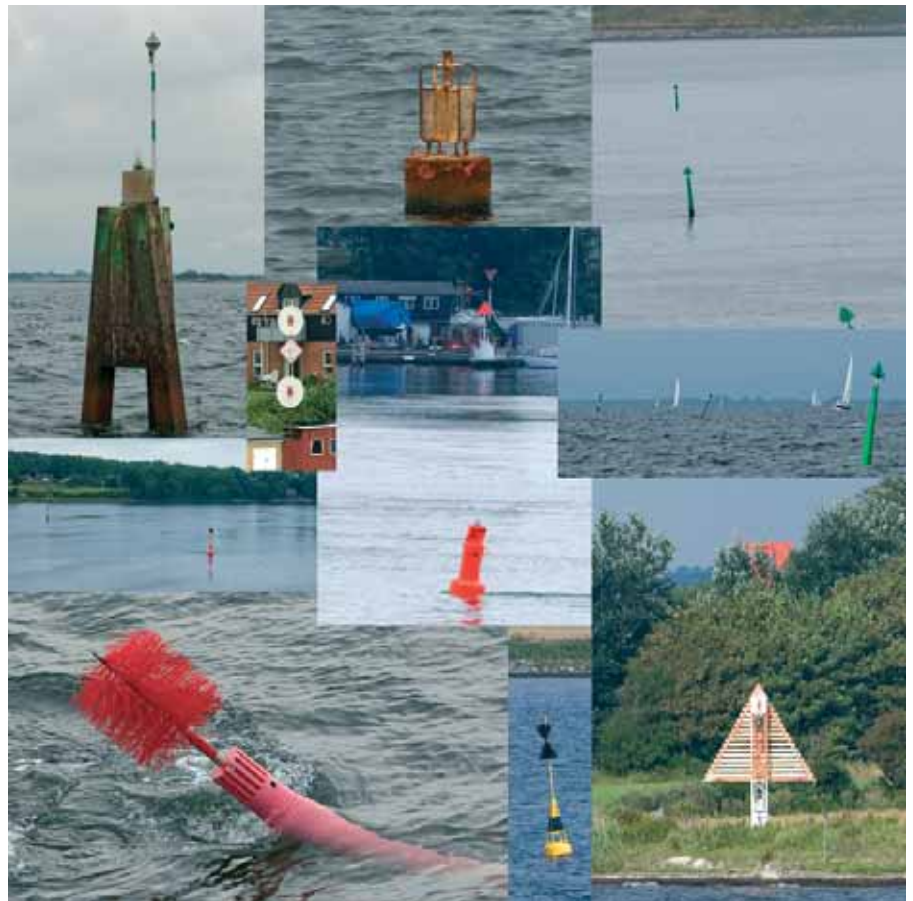
ca. 660 lystønder, 3650 vagere, 1400 båker og ca. 1800 fyr tjekkes løbende af Farvandsvæsenet. Senest på et togt med "Poul Løwenørn" den 11. 12. august 2010 i farvandet syd for Fyn.

En afmærkningsrevision omfatter altså på den ene side en fastsættelse af ejerforholdene i forbindelse med afmærkningen, og på den anden side en nautisk beskrivelse for den enkelte af-