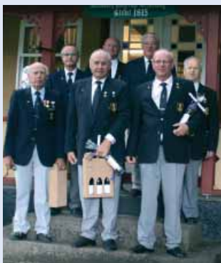
Skytterne fra Svendborg Marineforenings Skyttelav foran det smukke skyttehus i Christiansminde

Svendborg Marineforening ikke ligget på den lade side hen over sommeren. Sct. Hans aftenen blev fejret med grillmad og bål på kajen. Her mødte 60 op til en god aften med 0 sekundmeter vind og skyfri himmel. Den 11. juli sejlede "Caroline S" og "Viking" et stort hold medlemmer og ledsagere over til Marstal.