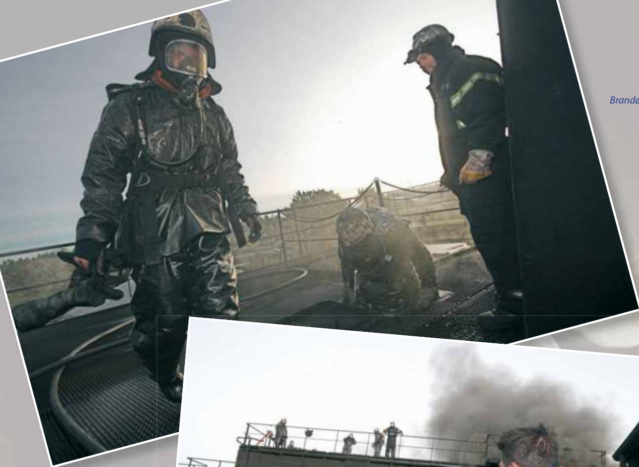
Brandøvelse er hårdt arbejde.