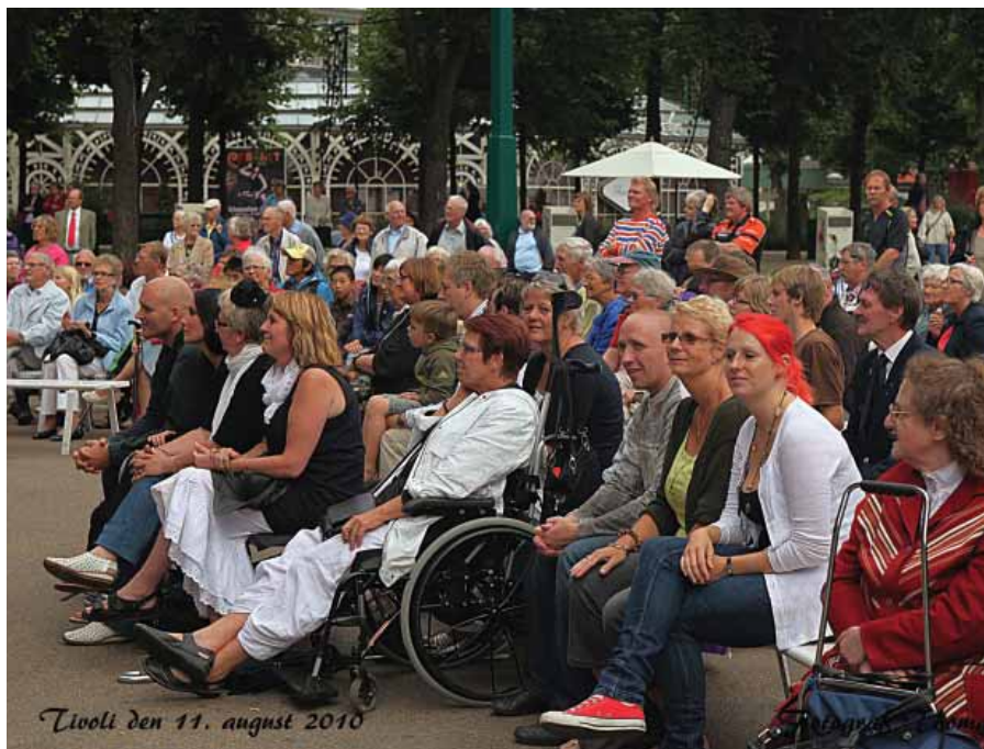
En tætpakket Tivoliplæne fik sømandsshanty af høj klasse, såvel den 10. af koret fra Ebeltoft som 11. august hvor det var koret fra Korsør der underholdte.

Ebeltoft Marineforening fik endda mulighed for at "sejle" den gamle have tynd med det hestetrukne afdelingsfartøj "Sluppen". - Sluppen "sejlede" gennem den gamle have kl. 1200 og 1400, hvor det festlige skue skabte stor begejstring blandt havens mange gæster. Bådsmandens fyndige kommandoer, lodhivernes lodskud med tilhørende muntre bemærkninger og gasterne sange skabte begejstrede bifald, når der gjordes holdt og flagbærerne gik omkring Sluppen. I dagens anledning var "raslernes" raslebøsser udskiftet med foldere, der fortalte om Sluppens historie. Indeni lå Danmarks Marineforenings hvervefolder og Fregatten JYLLANDs Jyllands appetitvækkende informationsbrochure. Kl. 1630 var det