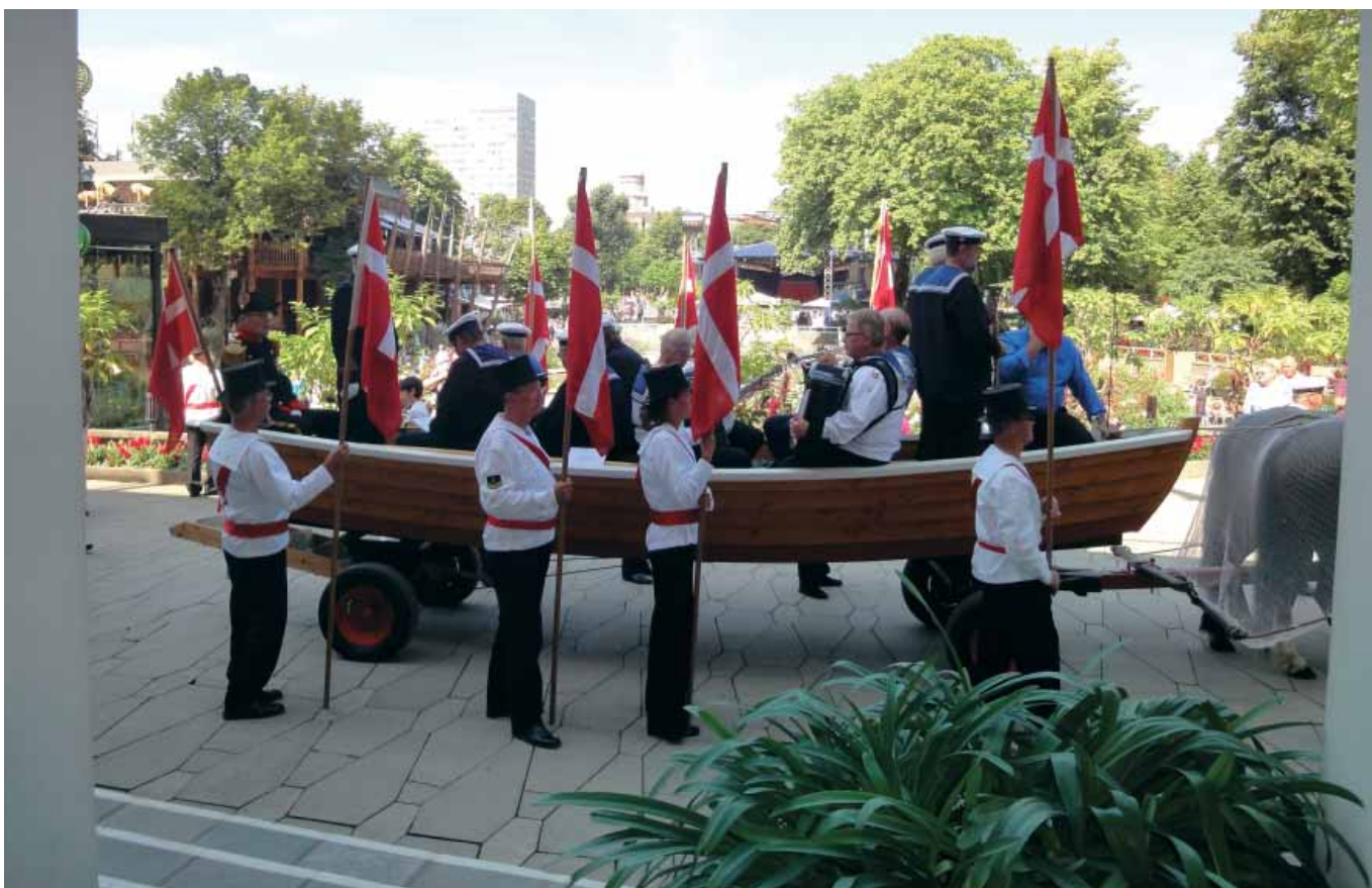
Slupkoret og Sluppen fra Ebeltoft blev hurtigt publikumsmagneter i Københavns Tivoli.

ud af underholdningen uden for scenekanten, opførte Korsør Marineforenings kor et musisk sceneshow. Også her var der stor applaus fra de mange gæster der stoppede op for at overvære underholdningen.