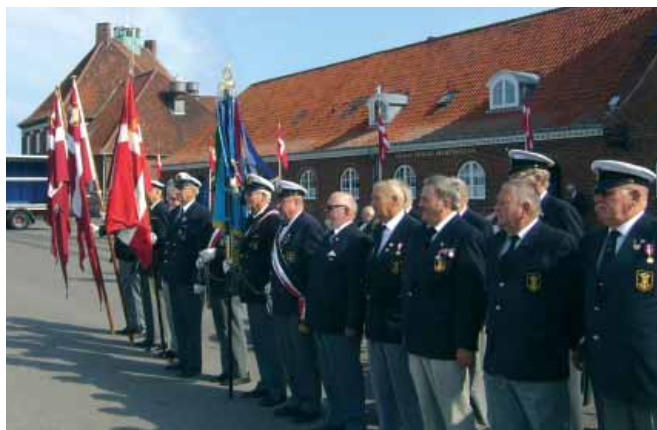
Medlemmer fra Nykøbing Sjælland og Nakskov Marineforeninger ved modtagelse af MHV 901 ENØ.

venhederne med march gennem Nakskov by. MHV 901 ENØ ankom efterfølgende til Nakskov Havn under flagparade og musik, hvorefter distriktsformand distrikt 6/Lolland Falster kontreadmiral Søren Torp åbnede den officielle del af arrangementet.