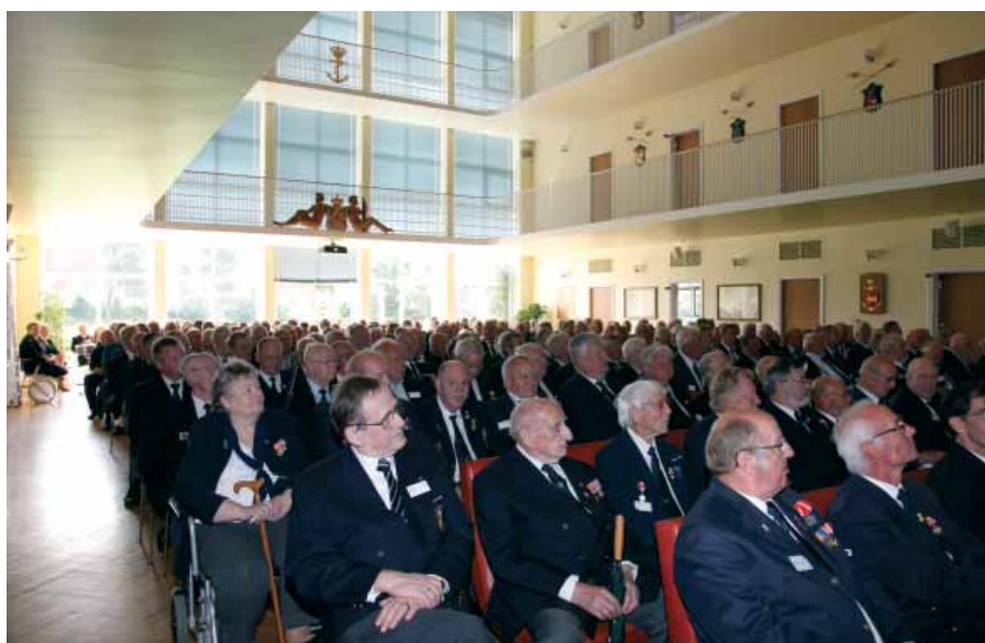
Jubilargæsterne fyldte op i aulaen på Søværnets Officersskole.