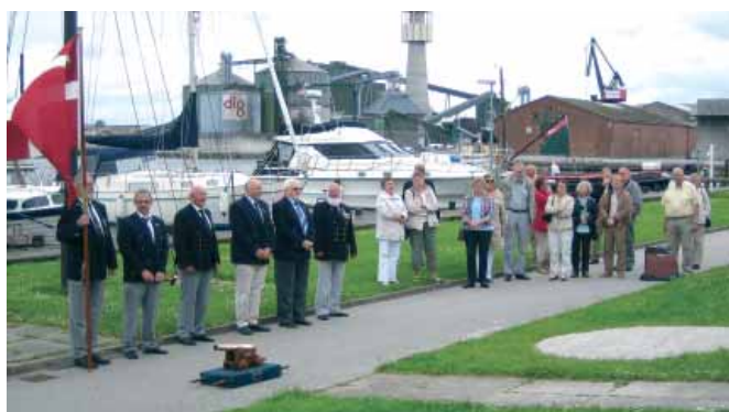
Sommerudflugten for Nibe Marineforening skydes i gang.