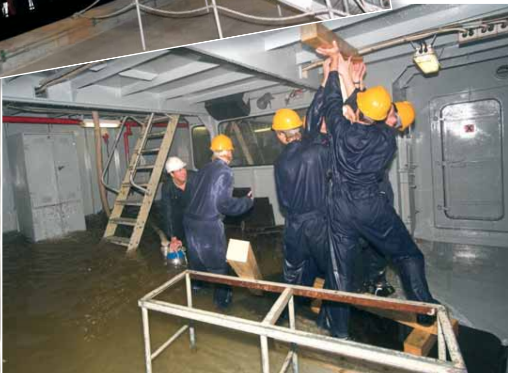
Der øves havari med efterfølgende vandindtrængning på DCU øvelsesenheden.