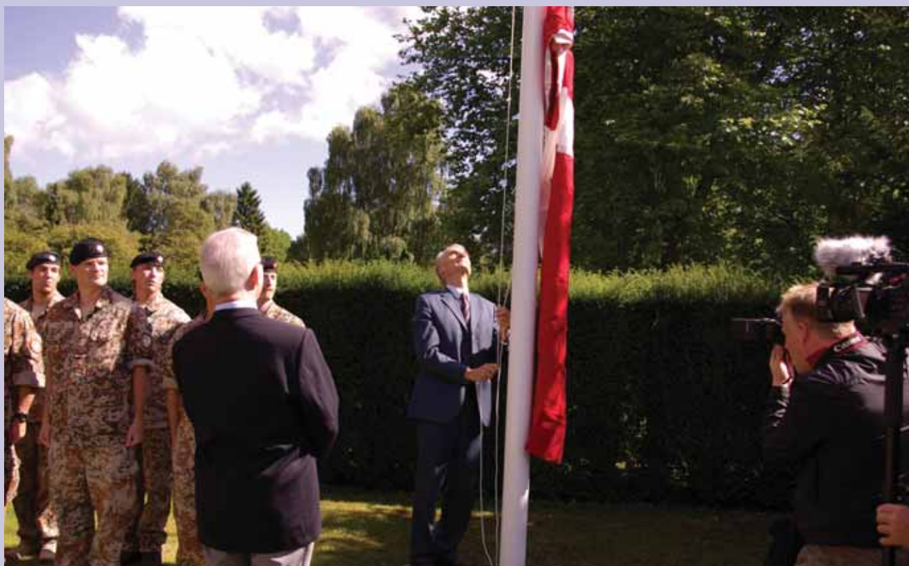
Indenrigs- og sundhedsminister Bertel Haarder i rollen som flaghejser.