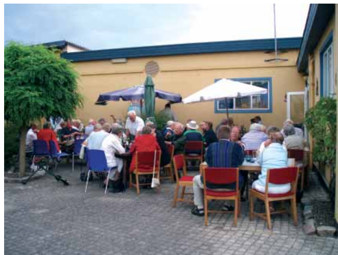
Der hygges i Marinehuset gård ved Ebeltoft Marineforenings sommergrillfest.

gjort på grund af dens styrke, dens dygtighed - strategisk og sømandsmæssigt - og dens evner i kamp. Men der har også altid stået ry og stor respekt om de skibsbygnings-konstruktioner og den udvikling af skibsbygningskunsten, den danske Flåde gennem årene har opbygget. Og om godt dansk skibsbygningshåndværk. Sådan var det, da Flåden blev genopbygget efter Benstrups tegninger, der var