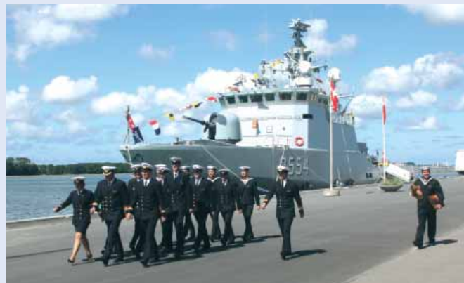
Vagtfri besætning fra MARKRELEN på vej med gaver til Lemvig Kommune og Lemvig Marineforening.

Den 14. august tog otte af afdelingens medlemmer med ledsagere på visit til kollegaerne på Fanø. Ifølge vel-