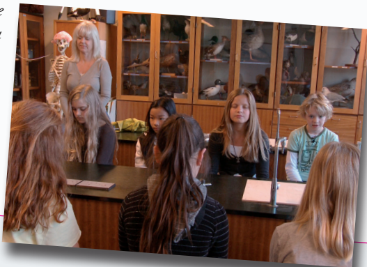
En scene fra filmen fra Risskov Skole.

Nærmere info på aalf.dk og ÅLF's Facebook og via din TR i slutningen af januar 2013.