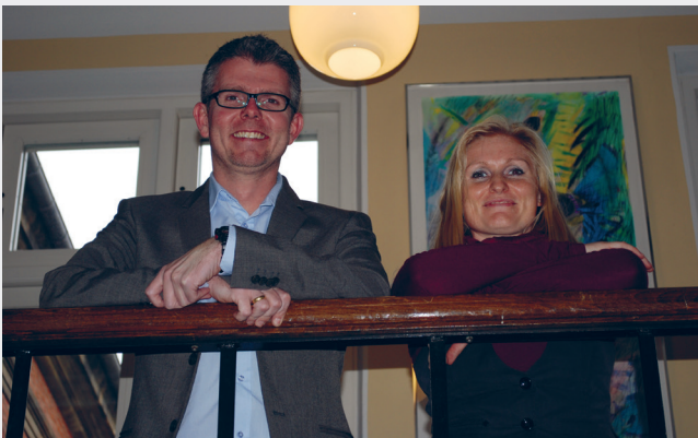
Skoleleder og TR fra Samsøgade Skole tror på det gode samarbejde.

– Medarbejderne kommer selvfølgelig til mig, når der er noget, jeg skal tage mig af. Men oftere bliver det for at få et godt råd om, hvordan man kan formulere sig om et problem, man har. Jeg er nemlig ikke længere den, man sender af sted foran sig. Kollegerne vil gerne selv i direkte dialog fx med ledelsen, forklarer hun.