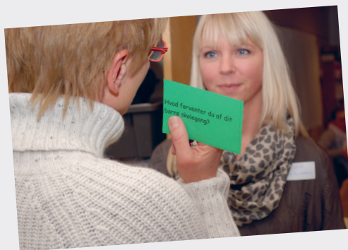
Forældre i samtale om deres forventninger