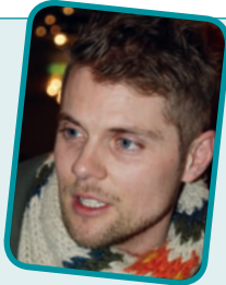
Rasmus Apel Engdalskolen

Talerne ændrede en enkelt stemme for mig, men ellers vidste jeg på forhånd, hvem jeg ville stemme på, inden jeg kom til generalforsamlingen. Der var i øvrigt fine oplæg fra talerstolen, og de stemte godt overens med de skriftlige oplæg.