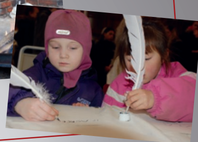
De mindste deltagere i festivalen over sig i fjerpenne-skrivningens svære kunst.