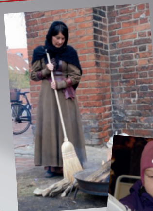
En tiggerkone ved Domkirken.

Ud over tiggeren ved Vor Frue Kirke kunne eleverne på deres byvandring blandt andet opleve en sjofel smædesangerinde, en erotisk digter, en hårdtarbejdende bager og en tårnråber i Domkirketårnet. □