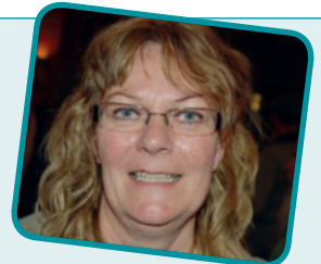
Lone Stephanie de Pauli Skæring Skole

Jeg stemte på to, jeg kender, og så kom der en tredje på min stemmeseddel på grund af et mundtligt valgoplæg med gode visioner.