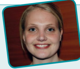
Signe Sørensen Skjoldbøjskolen

I den siddende styrelse er der en del, der minder om hinanden, så jeg ville gerne vælge noget mere forskellighed ind. Dét spillede ind på min stemmeafgivelse, men det helt afgørende for mig var den umiddelbare gennemslagskraft på talerstolen.