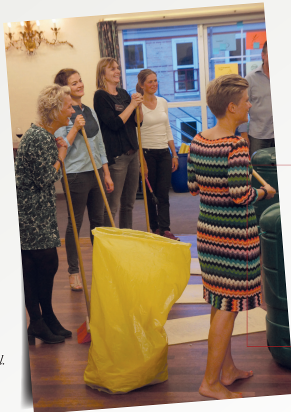
Internat, Odder Parkhotel.