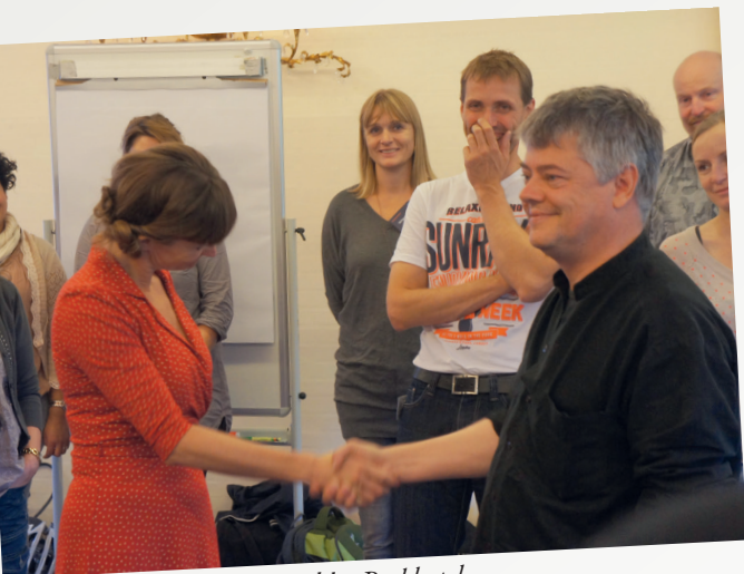
Internat, Odder Parkhotel.

– Der skabes allerede mange synergier i vores teams. Men hvor vi før nok hang fast i de samme punkter hver gang, har