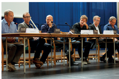
Også to skoleledere fra Finland og Canada var inviteret til at give de aarhusianske skoleledere input.

Folkeskolen er under forandring, inklusion er et tema og IT skal i de kommende år finde en rolle som et værktøj, der understøtter udvikling af en differentieret pædagogik og didaktik. Det skal 32 lærere, der alle har stor erfaring med at bruge IT i deres fag, nu være med til at føre ind i Aarhus Kommunes folkeskoler. De frikøbes alle en dag om ugen for sammen at fungere som ressourcepersoner i pædagogisk IT på tværs af skolerne. Initiativet er taget af Center for Læring i Børn og Unge – og centret samt kommunens skoleledelser og områdechefen fik ved arrangementet på Aarhus Rådhus en række kritiske og konstruktive kommentarer med på vejen af det indbudte forskerpanel: