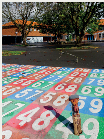
Freden har sænket sig over skolegården på Vikærvej.

Vi mødte en skole med øje for de mange intelligenser, men også skarp på at hjælpe med en klar struktur. Der blev fundet bøger til hver enkelt passende til niveau og læse-taktik, der var makkerlæsning og ma-