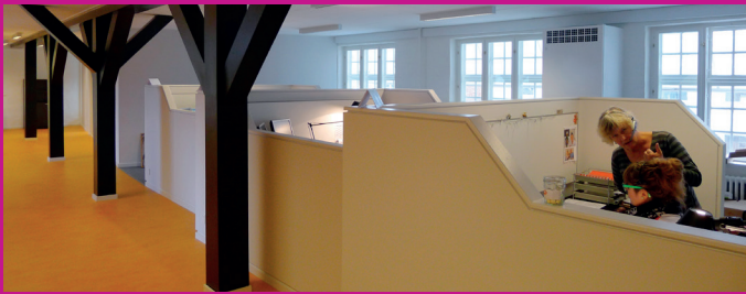
Udsnit af receptionsområdet med sekretærens arbejdspladser